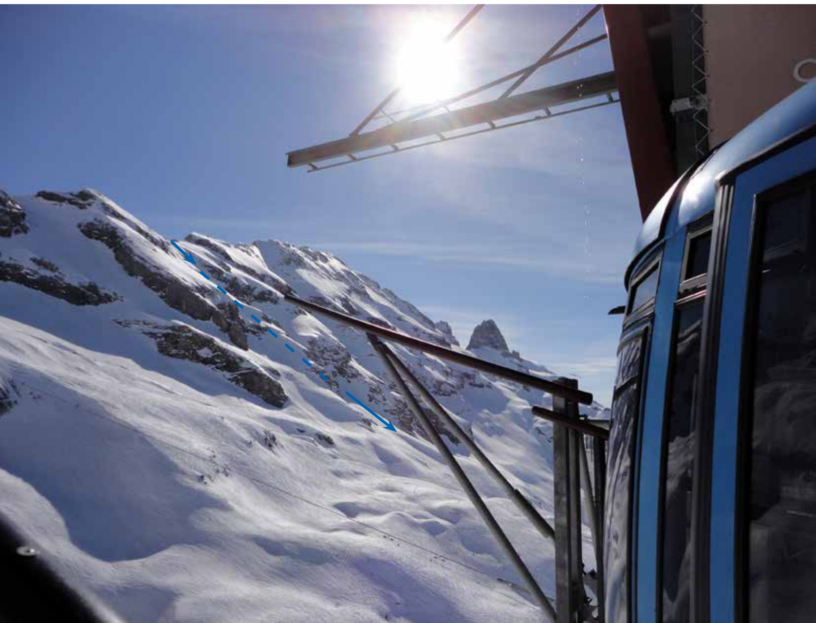
Vue du téléphérique sur le Reissend Nollen avec le couloir «Late afternoon» sur le côté.