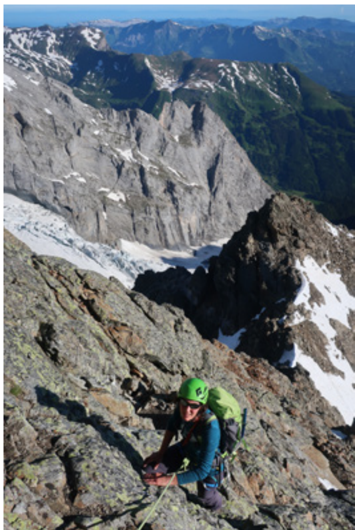
1 Sur la Tossengrat // 2 Montée à la cabane // 3 Conseil : Hotel Rosenluis // 4 Sur l'arête N.